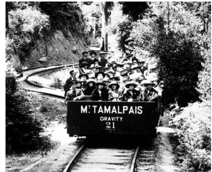
Vagón de Gravedad del Tren Escénico del Monte Tam, alrededor de 1900

A lo largo de los años, millones de personas han acudido a la montaña, llamada